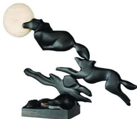
La chasse sauvage