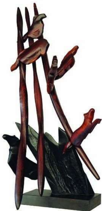
Les chevaux du vent